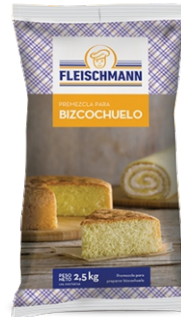
PREMEZCLA PARA BIZCOCHUELO