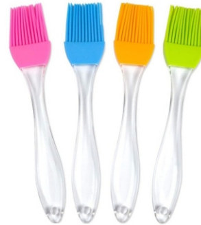
PRESENTACIÓN BROCHAS DE SILICONA