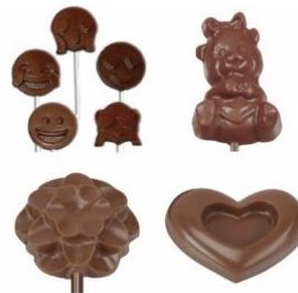
PRESENTACIÓN MOLDES PET