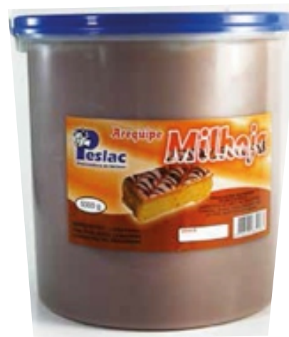
COBERTURA DE CHOCOLATE