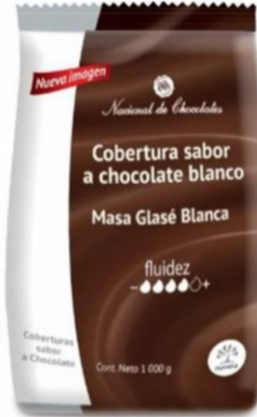
COBERTURA DE CHOCOLATE BLANCO