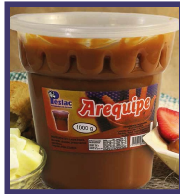
AREQUIPE PARA OBLEA