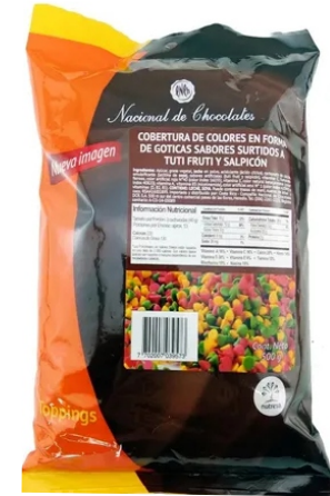
COBERTURA DE COLORES TUTI FRUTTI Y SALPICÓN