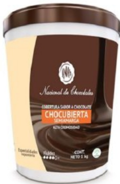
COBERTURA SEMIAMARGA CHOCOLATE