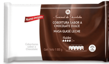
COBERTURA MASA GLASE LECHE