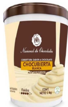
COBERTURA SEMIAMARGA BLANCA