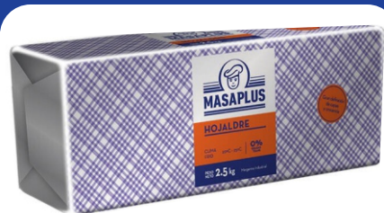
LEVADURA PARA HOJALDRE