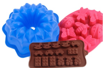
PRESENTACIÓN MOLDES DE SILICONA