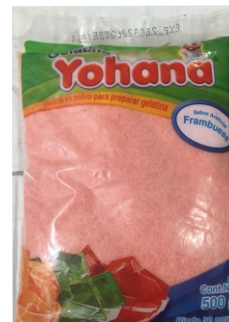
GELATINA YOHANA DE SABORES