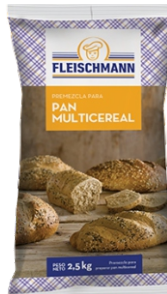
MEZCLA MIX DE PAN