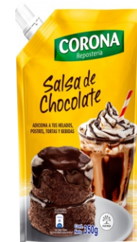
SALSA DE CHOCOLATE