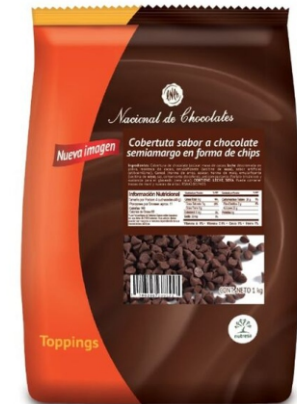
COBERTURA CHOCOLATI SEMIAMARGO CHIPS