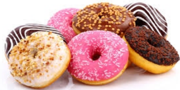
PREMEZCLA PARA DONAS