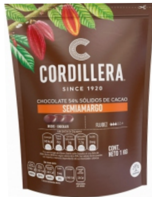
CHOCOLATE SOLIDO DE CACAO SEMIAMARGO