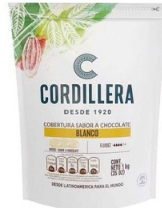
COBERTURA CHOCOLATE SEMIAMARGO BLANCO