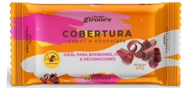
COBERTURA BLANCA COBERTURA NEGRA