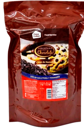
CHOCOLATE CHIPS DE HORNEO