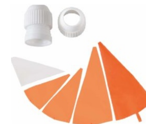
PRESENTACIÓN MANGAS Y ACOPLÉS