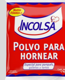
POLVO PARA HORNEAR