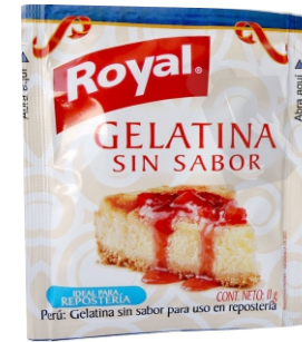
GELATINA SIN SABOR