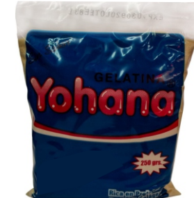
GELATINA SIN SABOR YOHANA