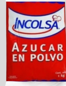
AZÚCAR EN POLVO