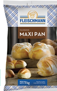
MEZCLA MIX DE PAN