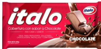
COBERTURA DE CHOCOLATE