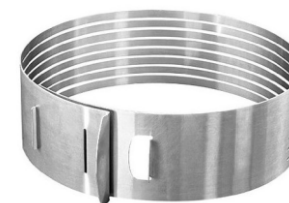
PRESENTACIÓN CORTADORES DETORTAS