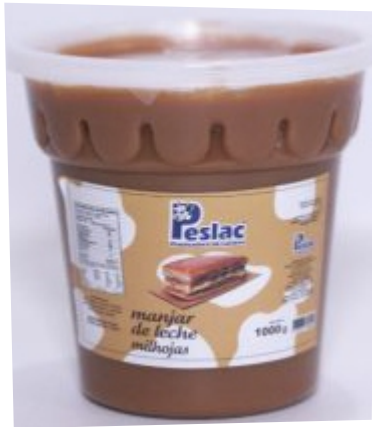
MANJAR DE LECHE