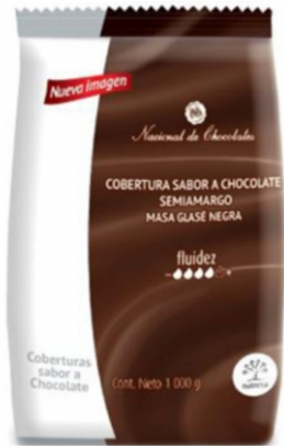
COBERTURA DE CHOCOLATE SEMIAMARGO