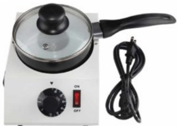
PRESENTACIÓN OLLA TEMPERADORA