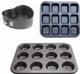
PRESENTACIÓN MOLDES DE ACERO